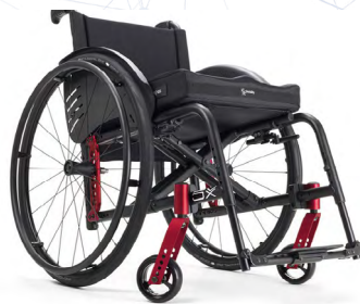
Imagen corresponde a la configuración de silla con extras.